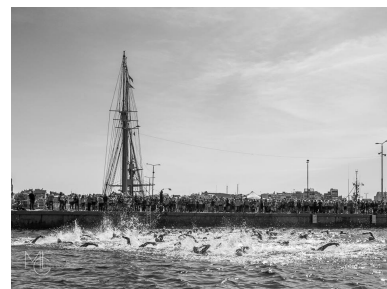
Cursa de natació al moll de Palamós, 2018.