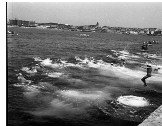
Cursa de natació al moll de Palamós, 1965.

Tot i que és una prova molt jove ja s'ha fet un lloc al calendari de molts nedadors. El darrer any s'hi van reunir uns 200 nedadors marcant l'inici de la temporada de les travesses d'aigües obertes. La caracteritza la seva famosa sortida saltant des del moll i combinant els seu dos recorreguts dins la badia, conserva l'essència de les travesses populars i l'emoció de la vessant competitiva fent que tots els nedadors, tant els que s'inicien com els que porten anys competint puguin gaudir d'un ambient festiu i familiar.